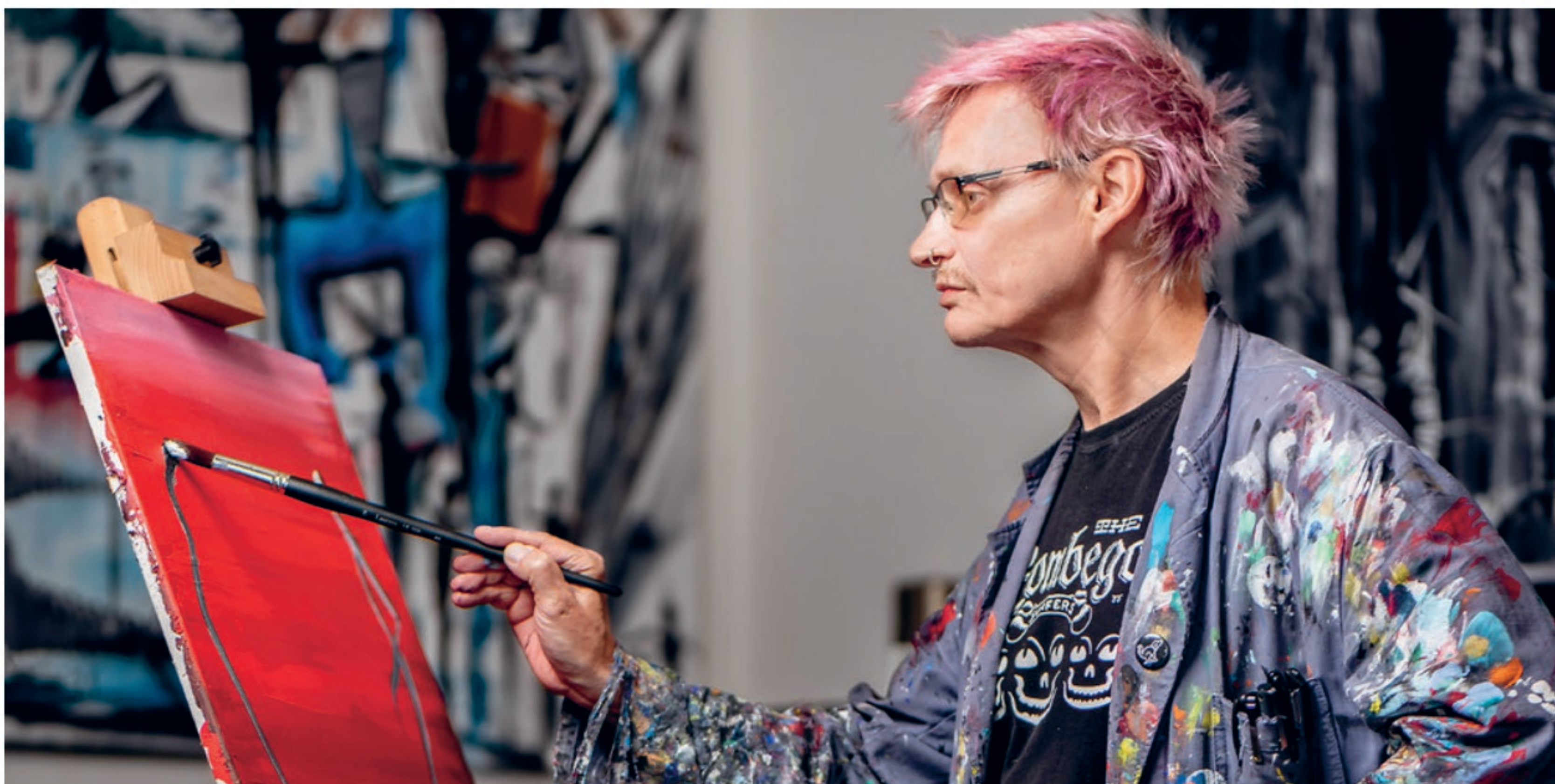
Ein Beispiel aus den 22 Porträts

Andi Keller Fotografie, Langgasse 136, 9008 St.Gallen, www.andikeller.ch , hallo@andikeller.ch , +41 (0)76 537 95 79