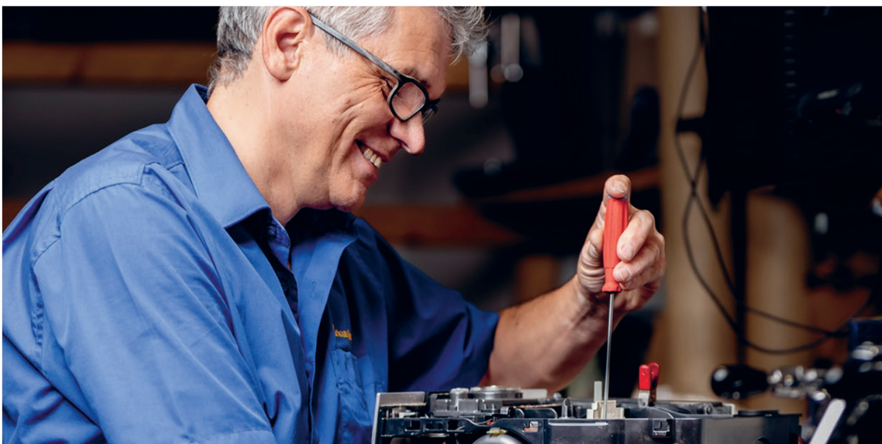
Ein Beispiel aus den 22 Porträts

Hinter den Fassaden der Gewerbehäuser an der Langgasse gehen täglich Menschen aus den unterschiedlichsten Branchen, Nationalitäten und Kulturen Ihrer Berufung nach. Sie machen andere Menschen glücklich, indem sie Lösungen für ihre Probleme entwickeln und anbieten.